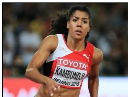
Un joli record pour Mujinga Kambundji

Au bénéfice d'un statut de favorite avec la troisième place des engagées, Selina Büchel (KTV Bütschwil) aura toutefois fort à faire à Pékin, face à une concurrence de premier choix. Mais à 23 ans, la championne d'Europe en salle de l'hiver dernier à Prague apprend très vite et son récent record suisse (1'57"95 il y a deux mois à Paris) atteste pleinement la grande forme de la Saint-Galloise. Au matin du 24 août, Selina assure facilement sa qualification pour les demi-finales en