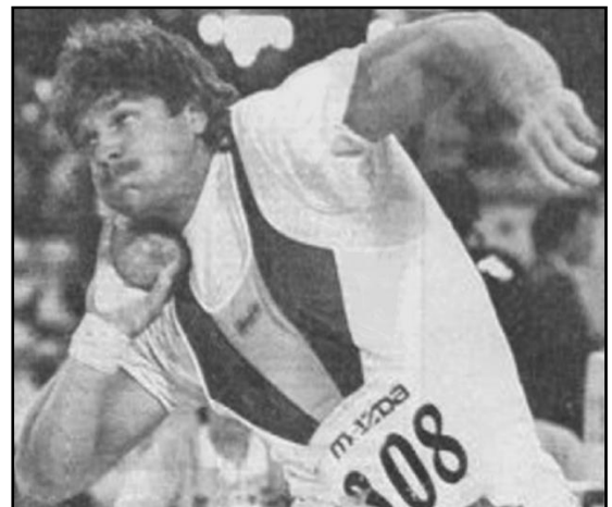
Werner Günthör décroche la médaille d'argent