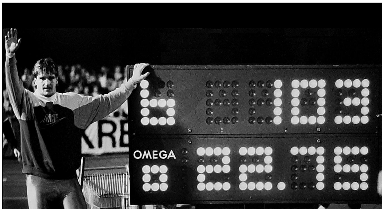
23 août 1988 au stade du Neufeld à Berne

Werner Günthör vient de lancer son poids à 22,75 m, 3ème performance mondiale de tous les temps à ce moment-là !