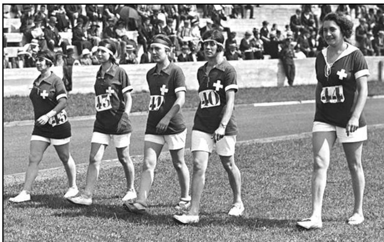
Les cinq Suissesses sélectionnées pour les Jeux Mondiaux Féminins à Paris

en a eu pour son argent car on enregistre des performances remarquables de la part des concurrentes venant de France, de Tchécoslovaquie, de Suisse, du Royaume-Uni et des États-Unis, le tout se traduisant par 18 records du monde améliorés en athlétisme, un domaine souvent dominé par les Britanniques. L'exception qui confirme la règle se déroule au lancer du javelot où Francesca Pianzola