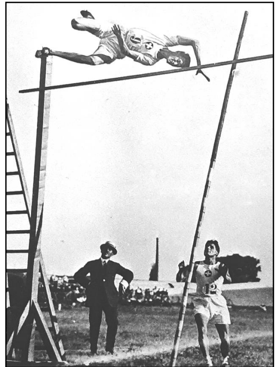
Juste après le saut à la perche, Ernst Gerspach pointe au quatrième rang du décathlon olympique

Le classement final de ce décathlon des Jeux Olympiques de 1924 à Paris est le suivant :