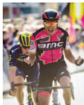
Greg Van Avermaet sacré.

Les candidats à la victoire au «Ronde» dimanche prochain sont donc au rendez-vous. En jambes. Et le grand favori se nomme Van Avermaet. «Je ne peux plus le caucher, je serai sans doute l'homme à battre, le favori», lâche-t-il après sa troisième victoire majeure en ce début de saison. Car avant Gand -