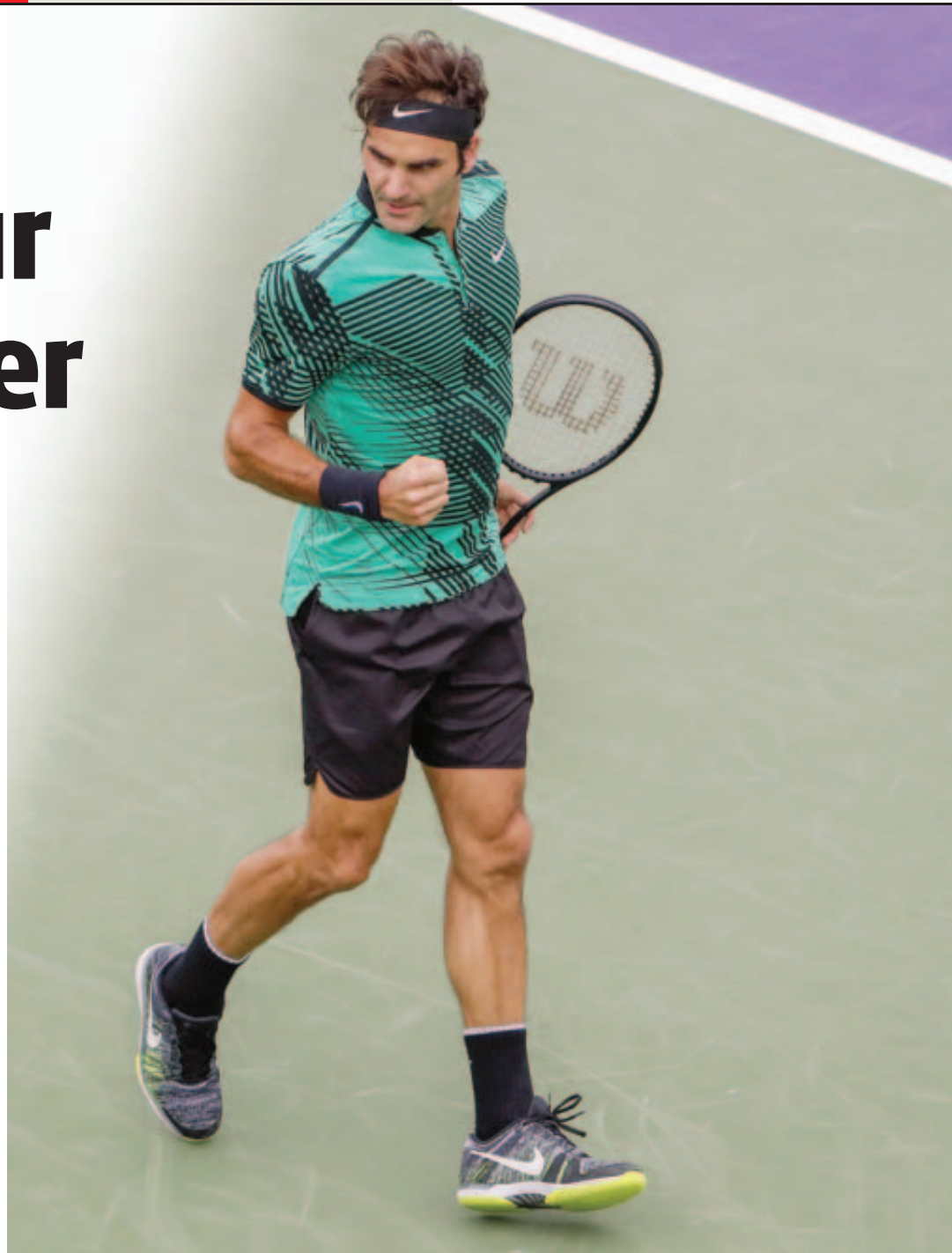
Roger Federer est en forme, il a remporté 14 de ses 15 rencontres disputées en 2017.

La tâche de Stan Wawrinka s'annonce sur le papier moins